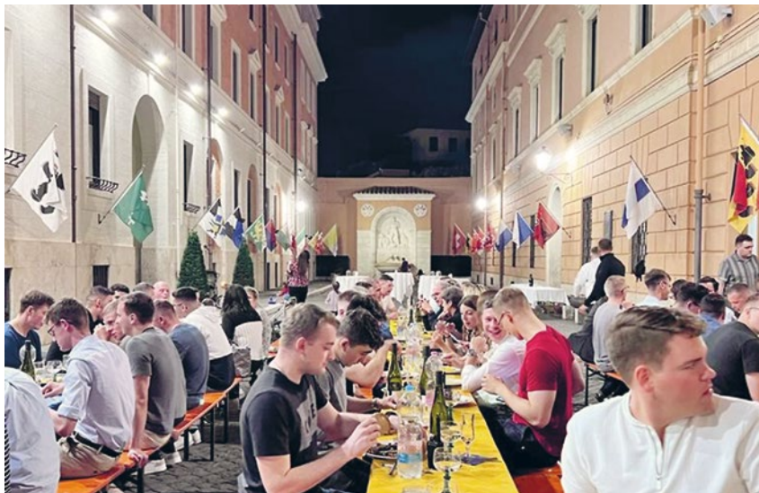
Soirée grillade dans la cour d'honneur de la caserne