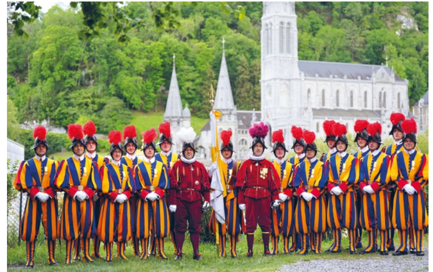
Pèlerinage à Lourdes

La Fondation soutient ces activités ainsi que diverses activités sportives et entraînements par des contributions financières. Le budget pour les activités culturelles s'élève à environ 50'000 CHF par an pour les prochaines années.