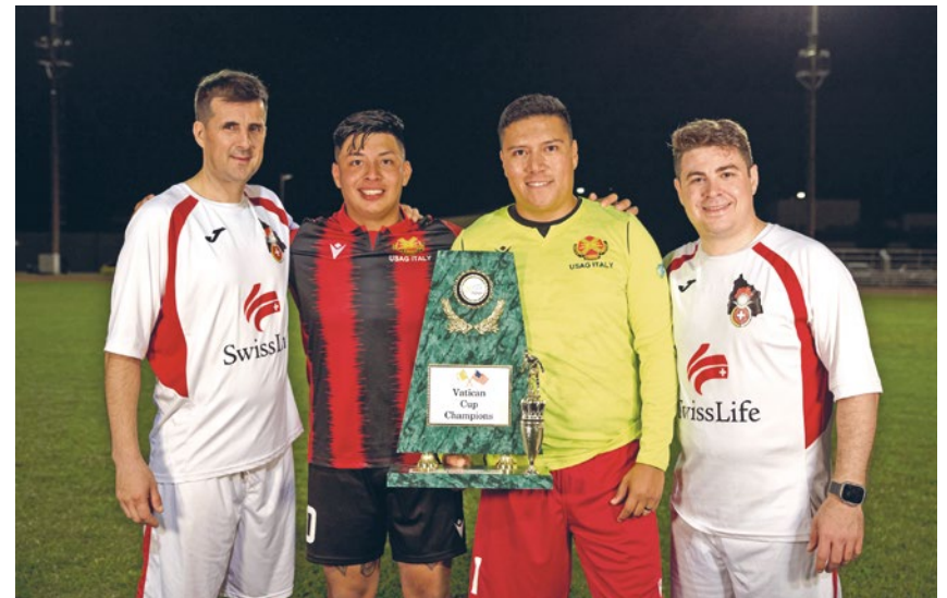
Le FC Guardia lors de la Coupe du Vatican